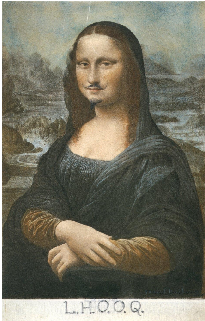
Marcel Duchamp, L.H.O.O.Q. , 1919, readymade rectifié, 19,7 x 12,4 cm ; estampe et crayon. Succession Marcel Duchamp, Centre Georges Pompidou, Paris.

Que vous suggèrent ces deux œuvres utilisant un même procédé d'appropriation/transformation ?